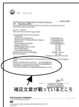
補足文章が載っているところ

当社オリジナル、AIU保険の「SP1」「ベーシック」「UNIT式」など AIU保険パンフレットプラン用 英文証明書のサンプル